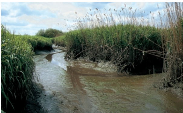
Priel mit Röhricht im Süßwasserwatt.

Die Pagensander Nebenelbe und die Insel selbst sind beliebte Ausflugsziele von Wassersportlern, besonders von