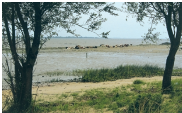
Seit Mai 2000 sorgen Ochsen als „Landschaftspfleger“ auf Pagensand dafür, dass Wiesenvögel wieder Brutplätze finden.

Die insgesamt ca. 520 ha große Elbinsel ist im Besitz des Bundes und wurde im Mai 1997 unter Naturschutz gestellt. Sie ist mit ihren seltenen, speziell an diese Lebensbedingungen angepassten Pflanzengesellschaften und Tierarten naturräumlich den großen Süßwasserwatt- und Flachwasser-Bereichen der Elbeniederung zuzuord-