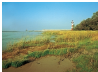
Spülsandhänge und Marschwiesen auf Pagensand.

Zweimal am Tag fallen die randlichen Süßwasserwatten trocken und werden dann wieder überflutet. Die Flachwasserbereiche an der Pagensander Nebenelbe bieten den Elbfischen wichtigen Lebensraum, um sich fortzupflanzen und aufzuwachsen. Die Pagensander Nebenelbe gehört bei uns zu den drei wichtigsten Rückzugsg-