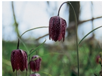
Die bedrohte Schachblume findet man noch im Pagensander Auwald.

Die Elbinsel Pagensand liegt zwischen der Pinnau- und der Krückaumündung vor den Außendeichsflächen der Seestermüher Marsch und ist von dieser durch die „Pagensander Nebenelbe“ getrennt. An der westlichen Inselseite verläuft das Hauptfahrwasser der Elbe. Die Insel gehört zur Gemeinde Seestermühe im Kreis Pinneberg. Ein kleiner Teil im Norden liegt in der Gemeinde Kollmar im Kreis Steinburg, ein sehr kleiner Teil der Südspitze der Insel in Niedersachsen.