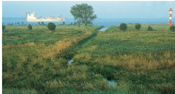
Süßwasserwatt, Binsen, Röhricht und Auwald an der Unterelbe mit Unterfeuer-Leuchtturm auf Pagensand.

Pagensand der Name bedeutet Pferdeinsel war ursprünglich nur eine vom Elbstrom geformte natürliche Sandbank. Im 19. Jahrhundert wurde sie mit einer benachbarten Insel vereint. Die größte Veränderung erfuhr Pagensand im 20. Jahrhundert. Die Insel wurde durch Aufspülungen im Zuge der Elbvertiefung zwischen 1910 und dem Beginn des