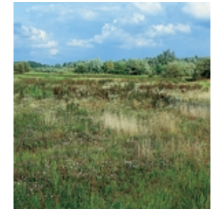
Ackerbrache auf ehemaligen Spülfeldern mit zahlreichen Ackerwildkräutern.

reichhaltiges Bodenleben an Schnecken, Würmern und Kleinstlebewesen aus, das einer Vielzahl von Enten- und Watvogel-Arten und Fischen als Nahrung dient.