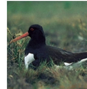
Der Austernfischer brütet auf einem ehemaligen Spülfeld.

Die Süßwasserwatten in der Unterelbe gehören zu den größten Mitteleuropas. Der Wattkomplex zwischen Eschschallen und Pagensand einschließlich Bishorst und Pinnaumündung stellt einen von fünf verbliebenen Großbereichen an der Unterelbe dar. Hier kommen an diese Verhältnisse besonders angepasste Pflanzengesellschaften vor: Große Flechtbinsen-Bestände mit verschiedenen Seebinsen-Arten und der Meerstrand-Simse sowie Brackwasser-Röhrichte mit der seltenen „Wibels Schmiele“, einer Grasart, die weltweit nur an der Unterelbe vorkommt. Die Wattflächen zeichnen sich durch ein