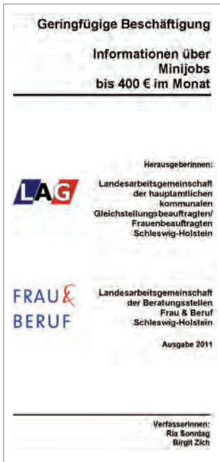
„Geringfügige Beschäftigung“ Herausgeberinnen: LAG, Frau & Beruf

Ebenfalls erhältlich bei den hauptamtlichen kommunalen Gleichstellungsbeauftragten in Schleswig-Holstein: