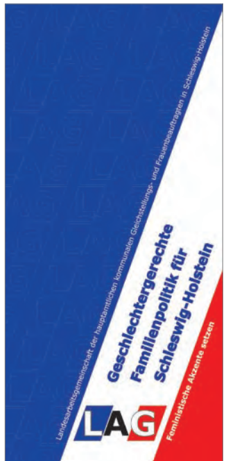
„Geschlechtergerechte Familienpolitik für Schleswig-Holstein“ Herausgeberin: LAG

Besuchen Sie unsere Homepage: www.gleichstellung-sh.de